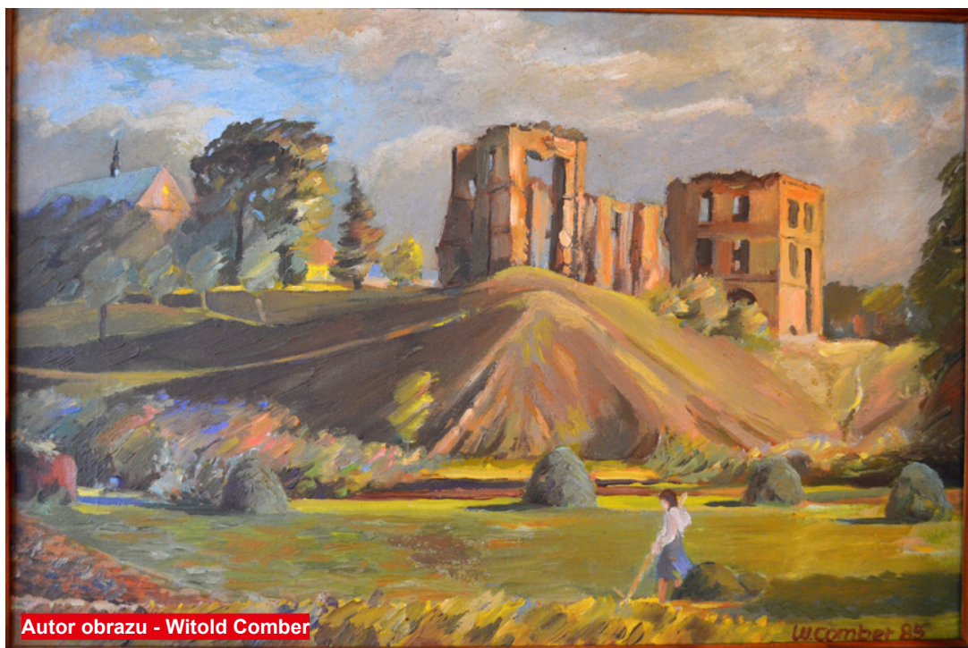
Autor obrazu - Witold Comber

W latach II wojny światowej Bodzentyn stanowił jeden z najbardziej znaczących ośrodków walk z niemieckim okupantem. Symbolem tego jest pomnik i mogiła 39 osób rozstrzelanych przez Niemców na Dolnym Rynku 1 czerwca 1943 r.