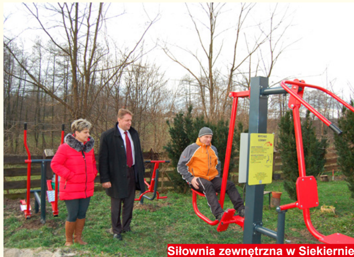
Siłownia zewnętrzna w Siekiernie

dzięki uzyskanemu dofinansowaniu funkcjonują cztery świetlice socjoterapeutyczne powstałe w ramach projektu „Utworzenie i rozwój świetlic środowiskowo-socjoterapeutycznych na terenie Miasta i Gminy Bodzentyń”. Dla dzieci prowadzone są zajęcia matematyki, edukacji społecznej i obywatelskiej, teatralne, taneczne, wokalne, sportowe, dziennikarskie, zajęcia korekcyjno-kompensacyjne z terapeutą pedagogiem, zajęcia z socjoterapeutą i psychoterapeutą.