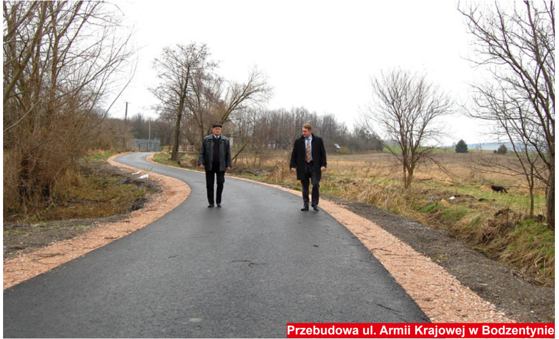
Przebudowa ul. Armii Krajowej w Bodzenty

Mieszkańcy ulicy Miejskiej w Bodzenty na nową drogę czekali 15 lat. Woda, która podczas deszczu spływała do tej pory z pól podmywała całą powierzchnię drogi i wypłukiwała kruszywo, którym droga była utwardzona. Teraz wszystko zmieniło się na lepsze. Zmodernizowana droga