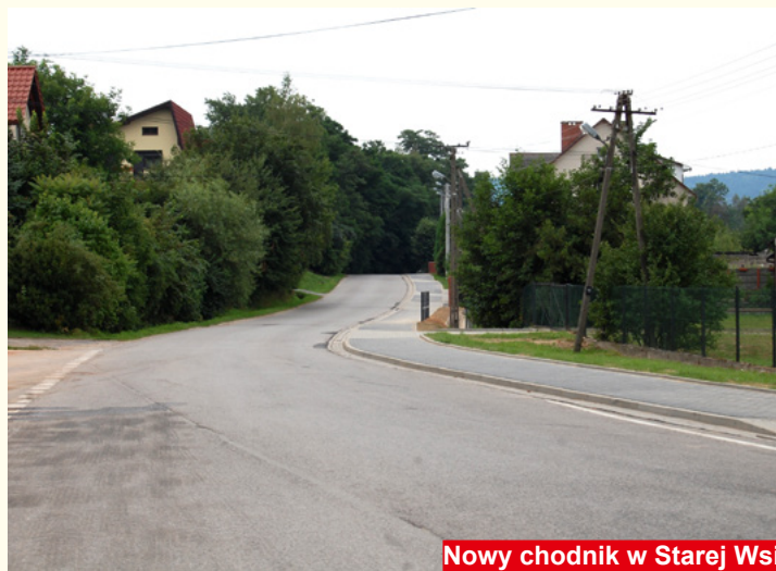
Nowy chodnik w Starej Wsi

nie rekompensuje wysokich kosztów utrzymania placówek oświatowych z uwagi na niską li-