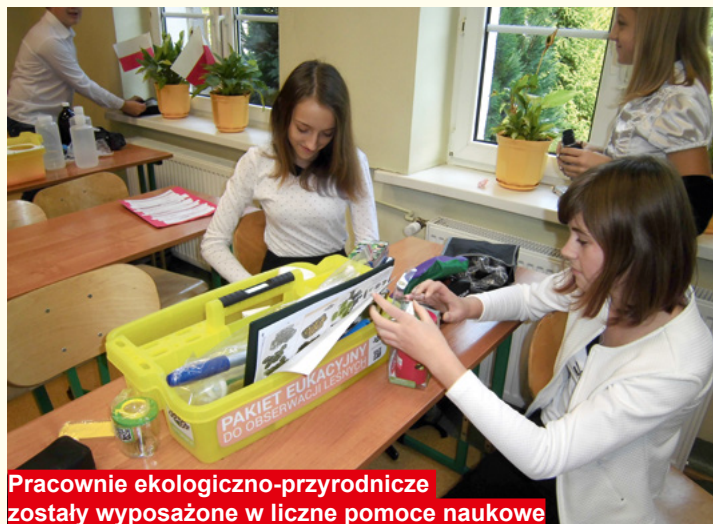
Pracownice ekologiczno-przyrodnicze zostały wyposażone w liczne pomoce naukowe

W ramach akcji profilaktycznych dla mieszkańców Gminy Bodzentyn zorganizowano akcją „Kocham, więc badam”, dzięki której przebadano 121 małych pacjentów. Dorosłe mieszkanki miały okazję wziąć udział w badaniach mammograficznych i cytologicznych, które były dostępne kilkakrotnie. Warto wspomnieć o bezpłatnym