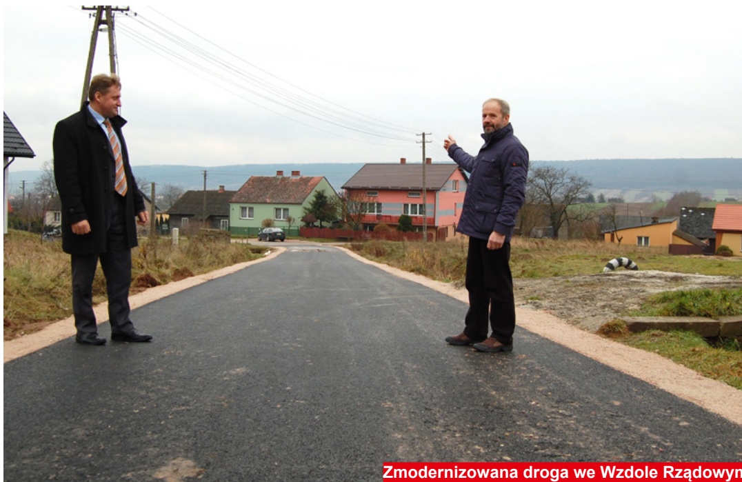
Zmodernizowana droga we Wzdole Rządowym