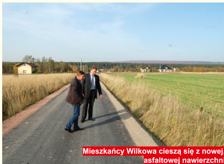
Mieszkańcy Wilkowa cieszą się z nowej, asfaltowej nawierzchni

Urząd Miasta i Gminy w Bodzentyń jest również udzielić pomocy materialnej dla uczniów z najbardziej potrzebujących rodzin wypłacając stypendia szkolne. W roku szkolnym 2016/2017 wypłacono