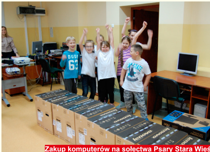
Zakup komputerów na sołectwa Psary Stara Wieś

impres sportowych i turystycznych należy wymienić organizowane w gminie biegi terenowe, rajdy piesze i rowerowe, a także nocny bieg nad zalewem w Wilkowie, który przyciągnął wielu biegaczy z całej Polski. Dzięki wsparciu finansowemu władz gminnych oraz zaangażowaniu prężnie działających klubów sportowych w gminie organizowane są liczne turnieje piłki nożnej, siatkowej, bilardowe czy zawody wędkarskie. Burmistrz również dużą uwagę zwraca na upowszechnianie kultury wspierając lokalnie działające stowarzyszenia, które przyczyniają się do promocji Gminy. Z roku na rok coraz większe fundusze są zabezpieczane w budżecie gminnym na działania na rzecz poszerzenia oferty kulturalnej oraz stwarzania możliwości