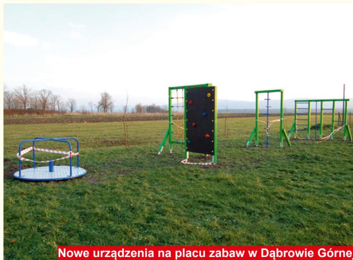
Nowe urządzenia na placu zabaw w Dąbrowie Górnej

Świątokrzyskie Dni Miodu, które cieszyły się dużym zainteresowaniem mieszkańców. Wśród