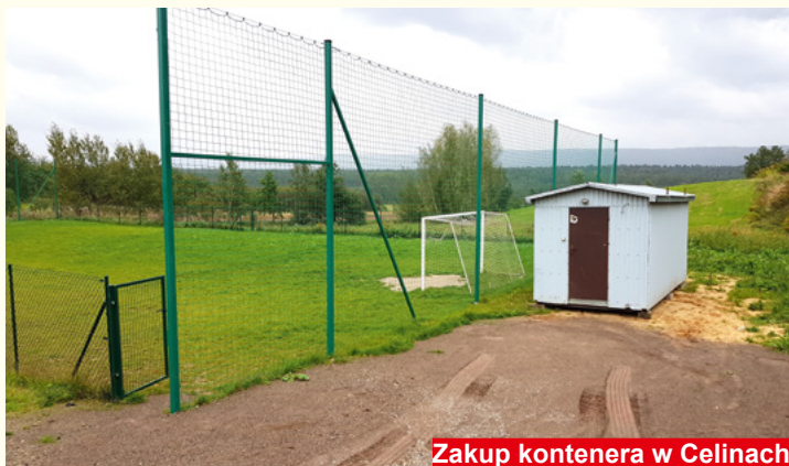
Zakup kontenera w Celinach

Projekt na oświetlenie uliczne dla miejscowości Podgórze