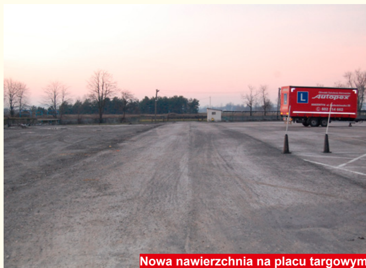
Nowa nawierzchnia na placu targowym

nie ze strony władz Miasta i Gminy Bodzentyn. W czerwcu tego roku władze gminy wyróżniły aż 70 gimnazjalistów, którzy w roku szkolnym 2016/2017 osiągnęli wybitne sukcesy sportowe, artystyczne i naukowe.