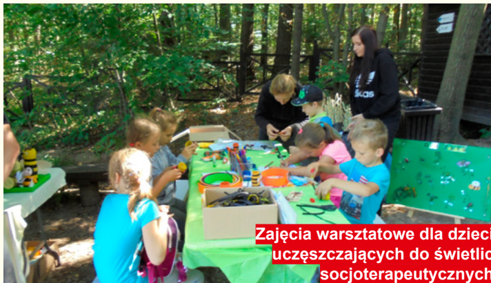
Zajęcia warsztatowe dla dzieci uczęszczających do świetlic socjoterapeutycznych

W ramach uzyskanych dofinansowań powstały świetlice socjoterapeutyczne dla dzieci, które zostały odpowiednio wyposażone dla potrzeb ich wychowanków. Nie można pomi-