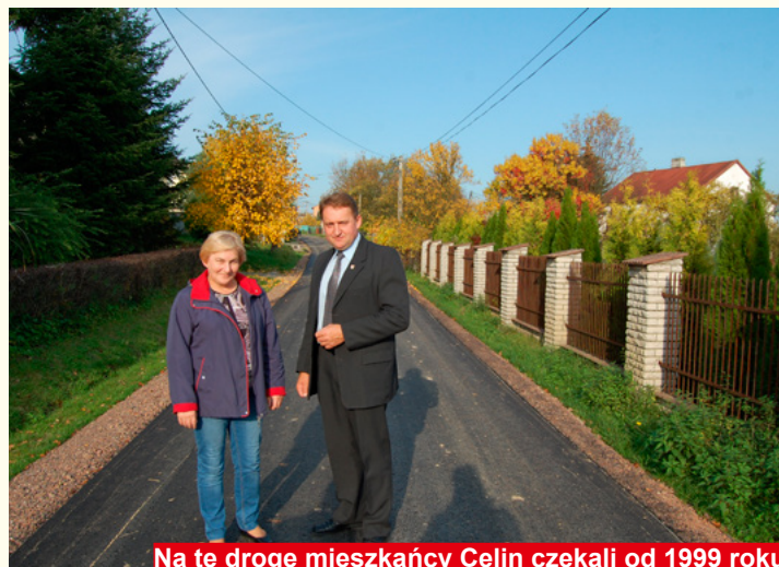
Na tę drogę mieszkańcy Celin czekali od 1999 roku

Wychodząc na przeciwcekiwaniom mieszkańców Gminy