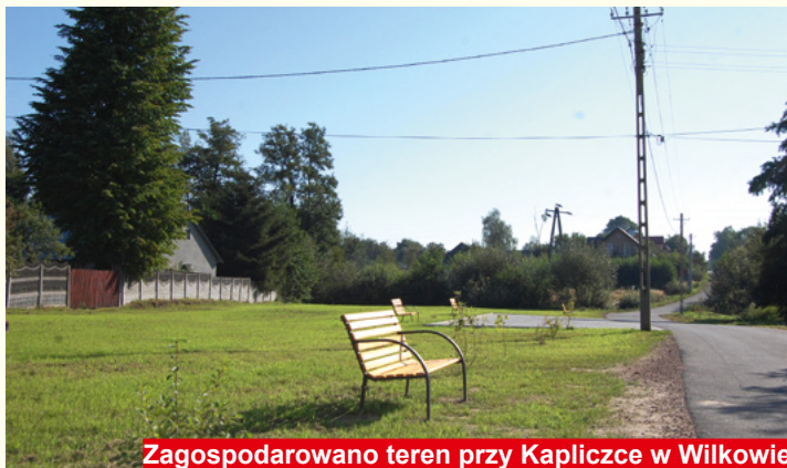
Zagospodarowano teren przy Kapliczce w Wilkowie

W zeszłym roku po raz pierwszy utworzono w naszej Gminie Budżet Obywatelski dla Miasta Bodzentyn. Zgodnie z oczekiwaniami mieszkańców w drodze głosowania zwyciężyły dwa projekty. Przy Gimnazjum w Bodzentynie powstała siłownia zewnętrzna wraz z ławkami.