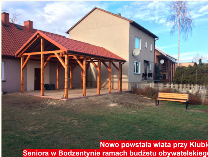
Nowo powstała wiata przy Klubie Seniora w Bodzentynie ramach budżetu obywatelskiego

Zgodnie z przyjętym „Programem opieki nad zwierzętami bezdomnymi oraz zapobieganiu bezdomności zwierząt na terenie Gminy Bodzentyn w 2016 roku” opieką nad bezdomnymi psami oraz prowadzeniem schroniska dla zwierząt zajmowała się firma „Baros” z Suchedniowa. Zgodnie z zapisami programu psy były wylapywane na zgłoszenie mieszkańców Gminy Bodzentyn. W okresie od 1 stycznia do 31 grudnia 2016 r. wylapano 41 psów. W roku 2017 do tej pory wylapano 31 psów.