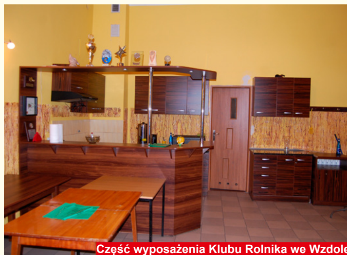
Część wyposażenia Klubu Rolnika we Wzdole

Bodzentyn oraz aby ułatwić im możliwość kontaktu z Urzędem z inicjatywy Burmistrza Dariusza Skiby powstał od września tego roku System Zgłaszania Obywatelskich Potrzeb (SZOP). Wszystkie zgłoszenia są szczegółowo rozpatrywane i przekazywane do odpowiednich komórek i referatów w Urzędzie