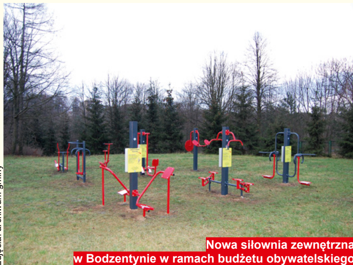
Nowa siłownia zewnętrzna w Bodzentynie w ramach budżetu obywatelskiego

jakości pracy urzędu. Ankietowani klienci urzędu pozytywnie ocenili pracę urzędników na polu ich kompetencji, kultury osobistej oraz życzliwości i gotowości do pomocy. Równie pochlebnie recenzowano jakość obsługi w Urzędzie, zarówno przez pryzmat kultury organizacji pracy jednostki, jak i architektury wewnętrznej siedziby lokalnej administracji.