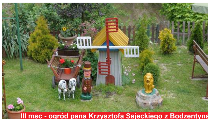
III msc - ogród pana Krzysztofa Sajeckiego z Bodzentyna