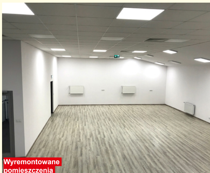
Wyremontowane pomieszczenia na potrzeby MGCKiT

Obecnie realizowana jest umowa dotycząca realizacji projektu pn. „Renowacja obiektów zabytkowych wraz z przebudową i wyposażeniem obiektów publicznej infrastruktury kulturalnej na obszarze gmin Gór Świętokrzyskich”, na który Związek Gmin Gór Świętokrzyskich uzyskał dofinansowanie w wysokości blisko 6 000 000,00 zł . W wyniku podpisania umowy w naszej gminie zostaną wyremontowane pomieszczenia OSP – częściowo nieużytkowane ze względu na ich zły stan techniczny. Kwota dofinansowania wyniesie min. 1 200 000,00 zł , całkowitą wartość realizacji zadania przewiduje się na około 2 700 000,00 zł .