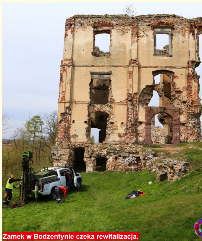
Zamek w Bodzentynie czeka rewitalizacja.

Umowa renowacji zamku dotyczy stworzenia szlaku pn. „Śladami kultury benedyktyńskiej”. Projekt został złożony przez Związek Gmin Gór Świętokrzyskich, zakłada on stworzenie szlaku kulturowego opartego na autentycznym dziedzictwie kulturowym regionu,