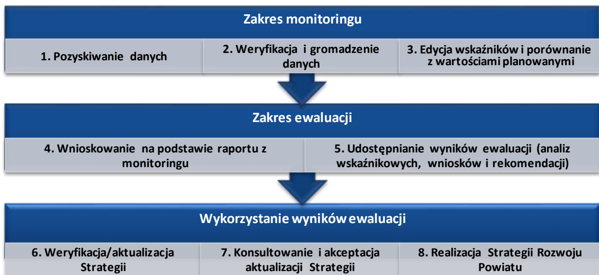
Rysunek 4. Proces monitorowania i ewaluacji Strategii

Proces monitorowania i ewaluacji Strategii prezentuje poniższy rysunek.