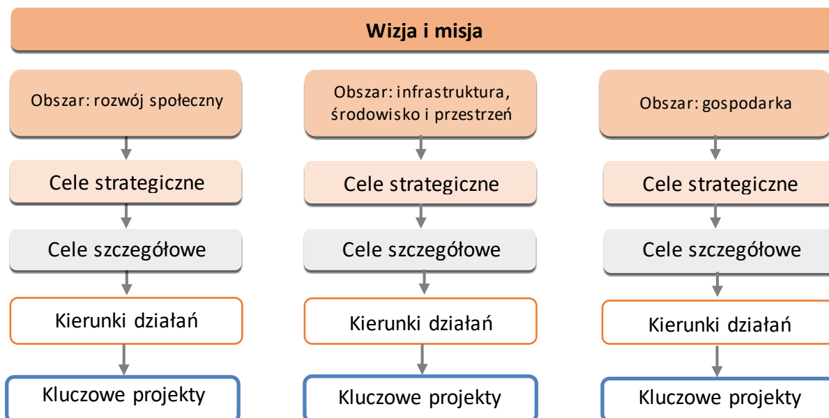
Rysunek 2. Drzewo celów i kierunków działań Strategii

Cele i kierunki działań Strategii są prezentowane w formie drzewa, odrębnie w trzech obszarach: gospodarczym, społecznym i infrastrukturalnym (obejmującym również środowisko i kwestie przestrzenne).